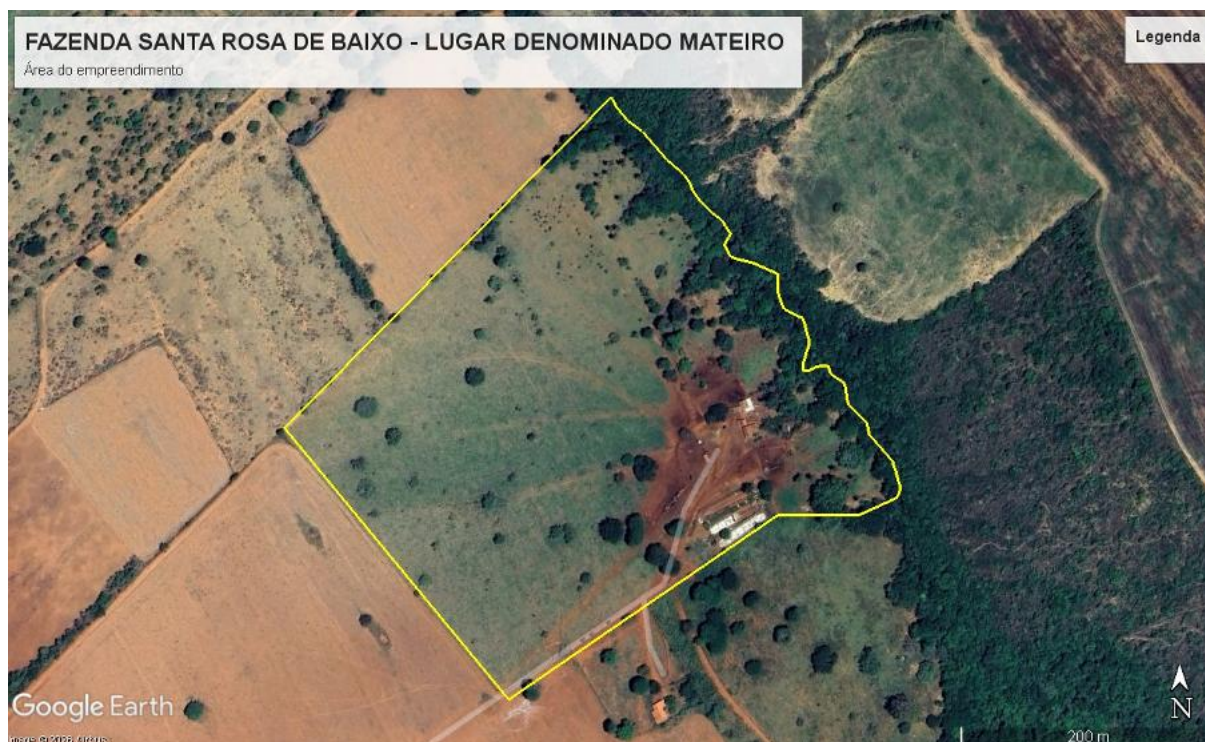
Figura 1– Imagem aérea do empreendimento.

O empreendimento Fazenda Santa Rosa de Baixo lugar denominado “Mateiro”, está situado na zona rural do município de Coromandel – MG, tendo como pontos de referência as coordenadas geográficas 267756| 7933868, Datum WGS84.