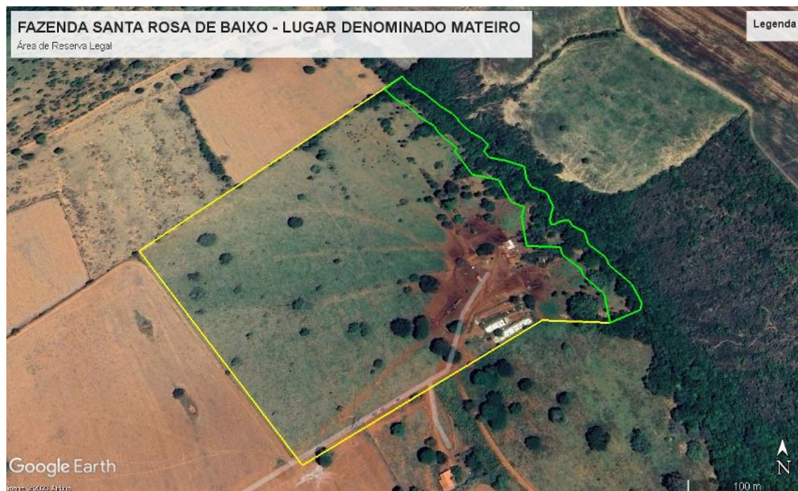
Figura 3– Área de Reserva Legal