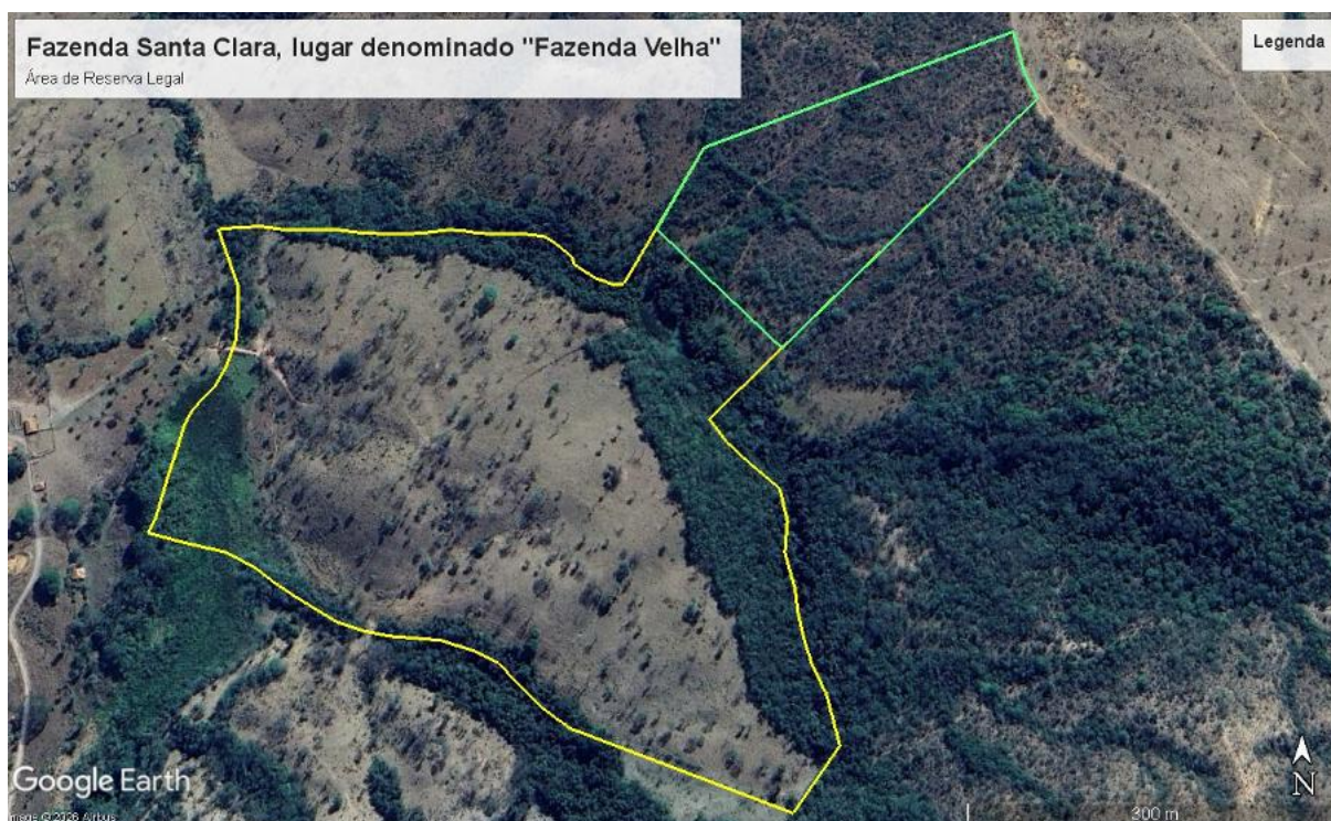
Figura 3– Área de Reserva Legal