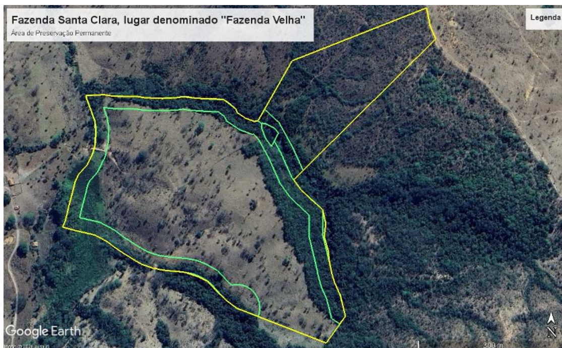
Figura 2 – Área de Preservação Permanente

A Fazenda Santa Clara – lugar denominado Fazenda Velha possui Área de Preservação Permanente (APP) de 05.44.17 hectares como mostra a imagem do Google Earth, a seguir: