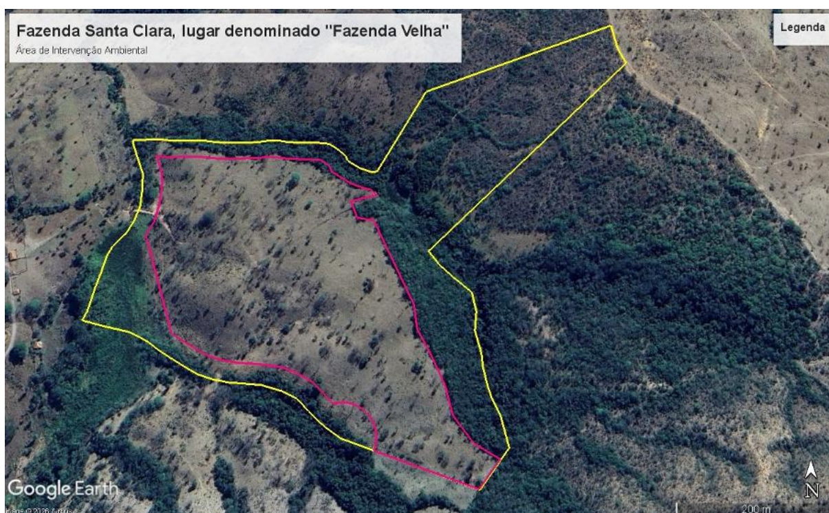
Figura 5 – Área Requerida para Intervenção Ambiental