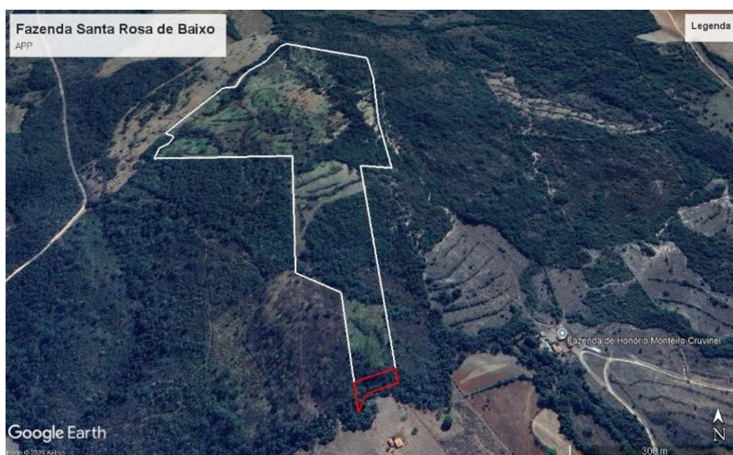
Figura 2 – Área de Preservação Permanente

A Fazenda Santa Rosa de Baixo possui Área de Preservação Permanente (APP) de 00.28.93 hectares, a mesma encontra-se em bom estado de conservação como mostra a imagem do Google Earth, a seguir: