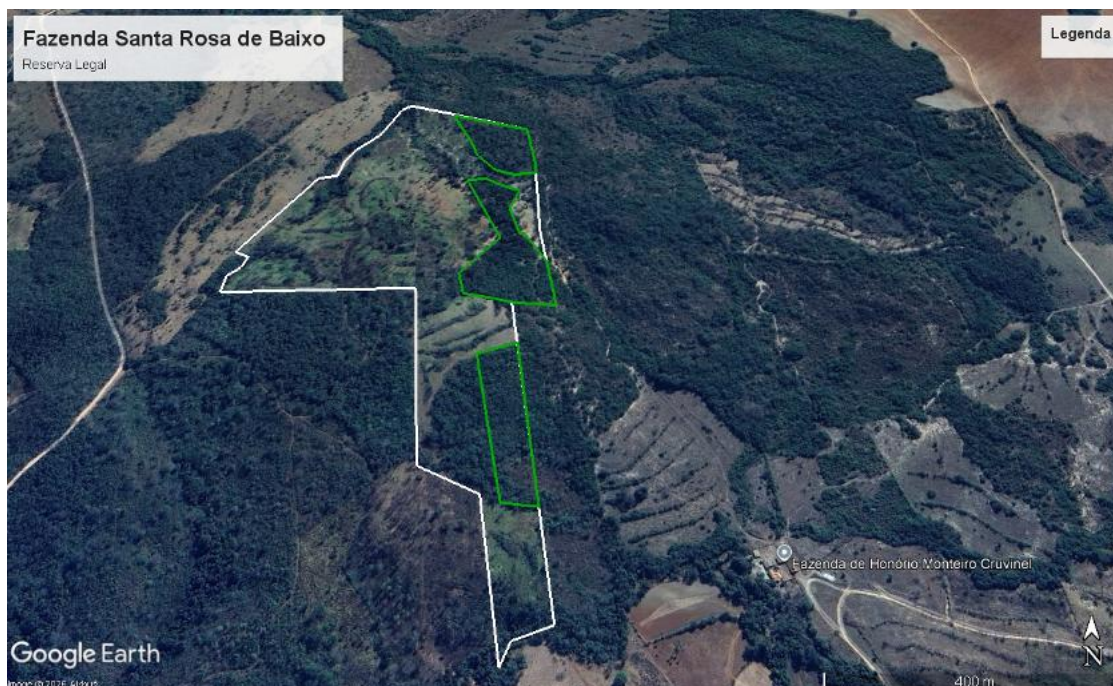
Figura 3– Área de Reserva Legal

encontra em bom estado de conservação em área de cerrado, como mostra a imagem do Google Earth a seguir.