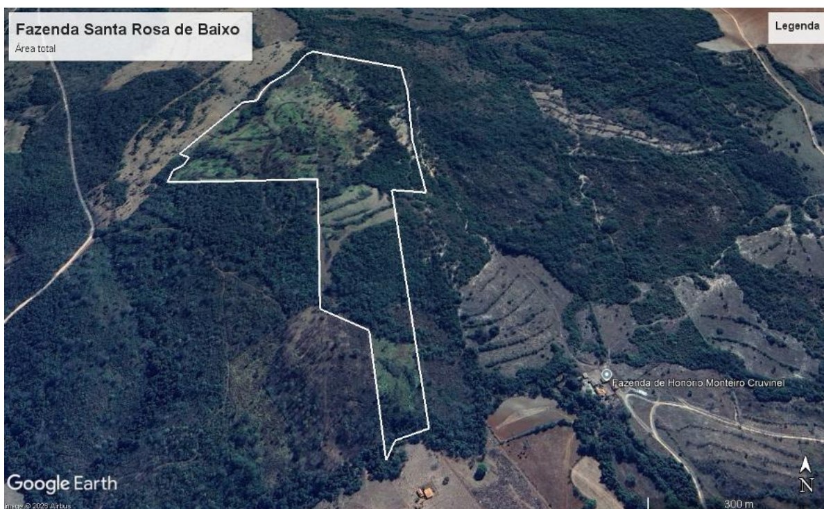
Figura 1– Imagem aérea do empreendimento.

O empreendimento Fazenda Santa Rosa de Baixo - Matrículas nº 34.164, 34.044 e 34.005 está situado na zona rural do município de Coromandel – MG, tendo como pontos de referência as coordenadas geográficas 255620|7937331 Datum WGS84.