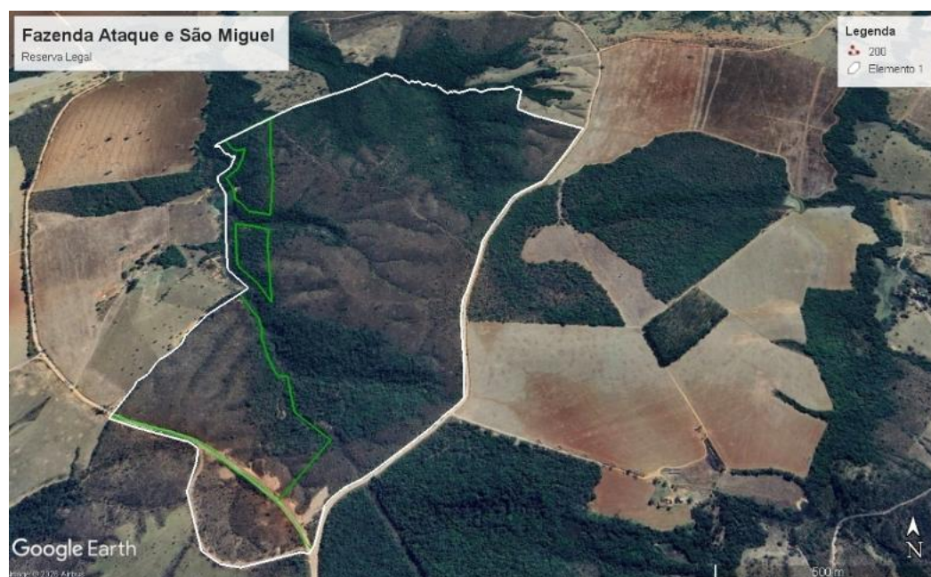
Figura 2– Área de Reserva Legal

Quanto à Reserva Legal do imóvel, a mesma se encontra averbada na matrícula com área de 31.05.00 hectares, área não inferior aos 20%, exigidos por lei. A mesma se encontra em bom estado de conservação em área de campo cerrado, como mostra a imagem do Google Earth a seguir.