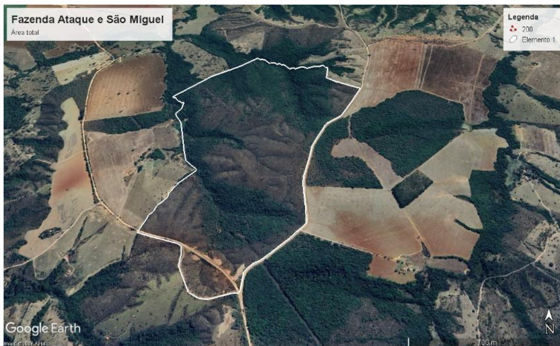
Figura 1– Imagem aérea do empreendimento.