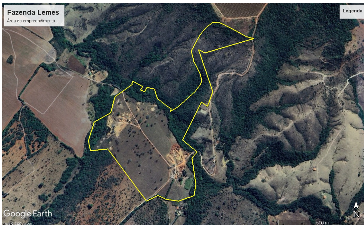
Figura 1– Imagem aérea do empreendimento.