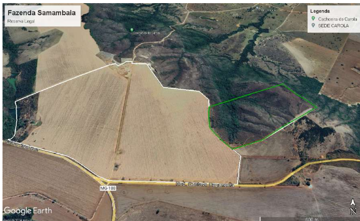
Figura 3– Área de Reserva Legal