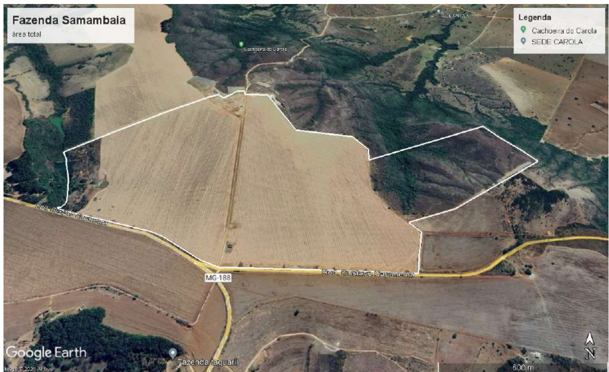
Figura 1– Imagem aérea do empreendimento.

O empreendimento Fazenda Samambaia está situado na zona rural do município de Coromandel – MG, tendo como pontos de referência as coordenadas geográficas 271429 | 7954498, Datum WGS84 .