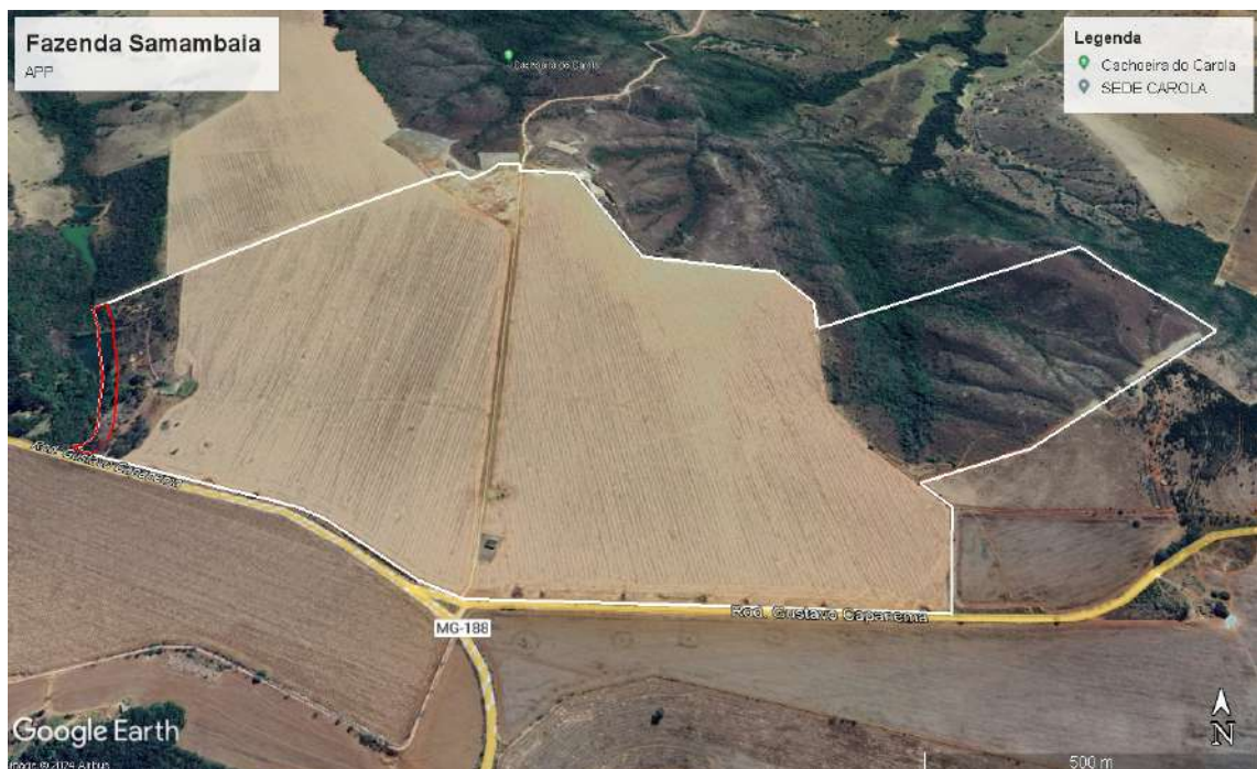
Figura 2 – Área de Preservação Permanente

A Fazenda Samambaia possui Área de Preservação Permanente (APP) de 01,4136 hectares em bom estado de conservação como mostra a imagem do Google Earth, a seguir: